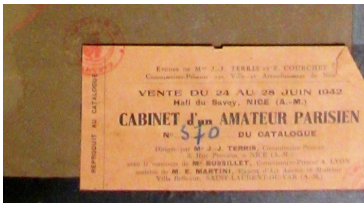
Veilingeticket achteraan op de aquarel.

de hij zich blijkbaar niet zo graag bloot aan de mediterrane zon. Het waren drie van de werken die hij er liet aankopen die onlangs in Berlijn werden teruggegeven aan de familie Dorville.